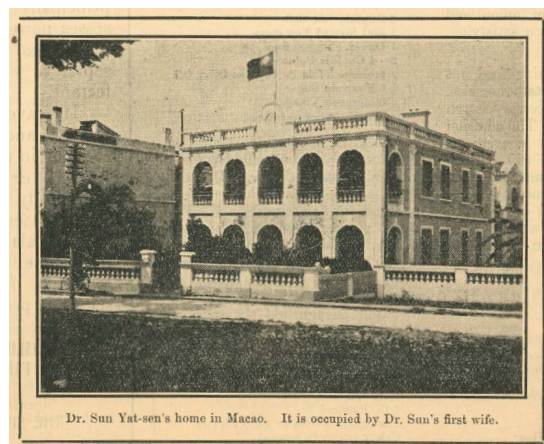
圖 4.5.2：文第士街 1 號房屋原貌，不晚於 1930 年攝。