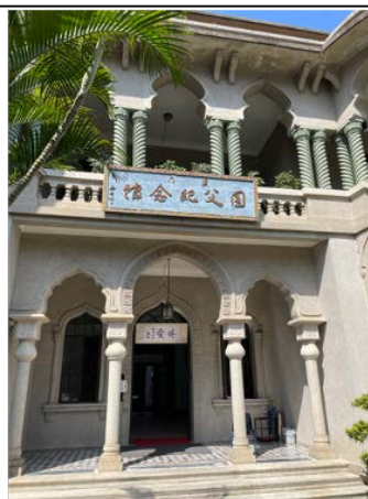
圖 4.5.8：房屋立面富含伊斯蘭建築風格的裝飾元素，如二樓柱廊的綠色水磨石麻花柱、尖型拱廊等。