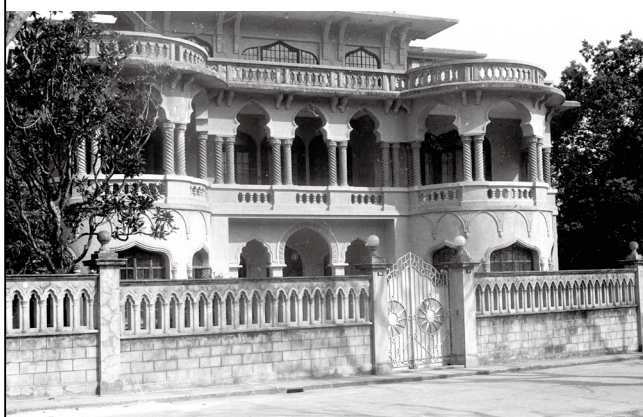
圖 4.5.5：二十世紀五十世代尚未改用作展示館前的面貌。