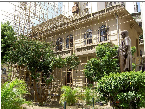
圖 4.5.7：2005 年房屋進行天面防水等修復工程。