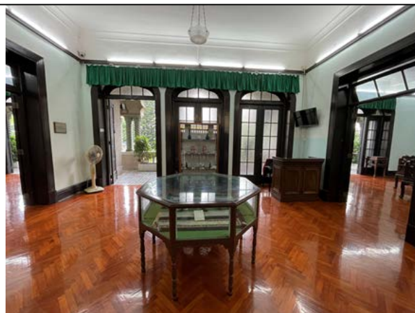
圖 4.5.10：展示館二樓正廳展示着孫氏家人的生活用品以及孫中山在澳門行醫時的物品等。