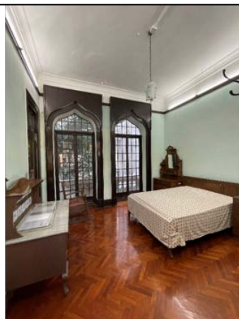
圖 4.5.9：展示館部份房間保留昔日的生活擺設。