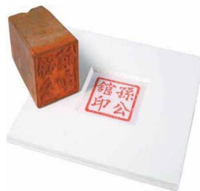
圖 4.5.4：孫公館印章，原件由香港歷史博物館藏。