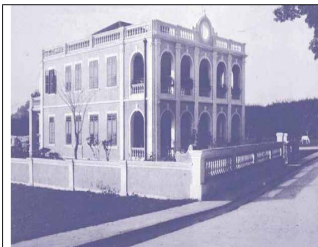
圖 4.5.1：文第士街 1 號房屋原貌，1919 年攝。