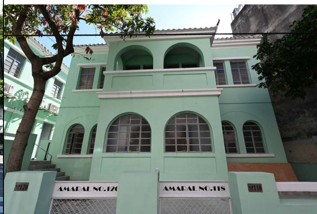
圖 2.5.4：連勝馬路 118-120 號之正立面