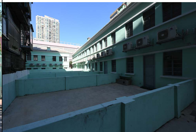
圖 2.5.2：建築群之後立面