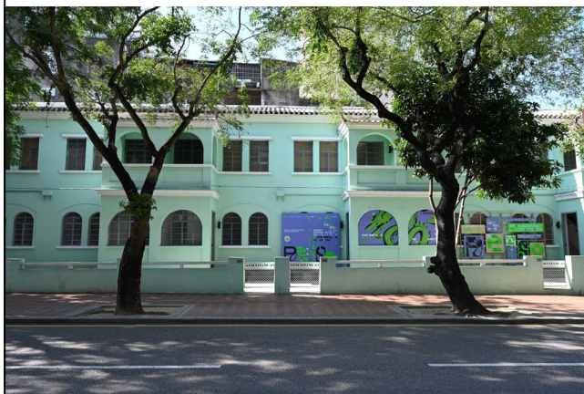
圖 2.5.1：聯排房屋建築群之正立面