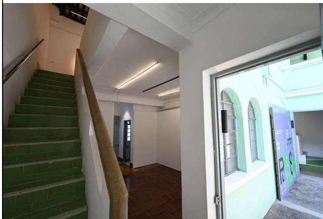
圖 2.5.5：大門及連接一層及二層的室內樓梯