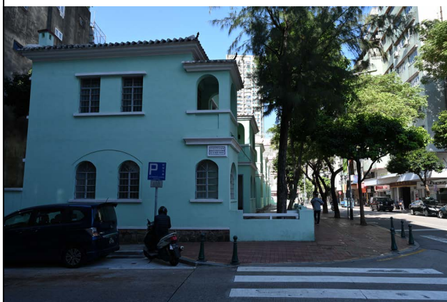
圖 2.5.3：美副將大馬路 55 號建築側立面