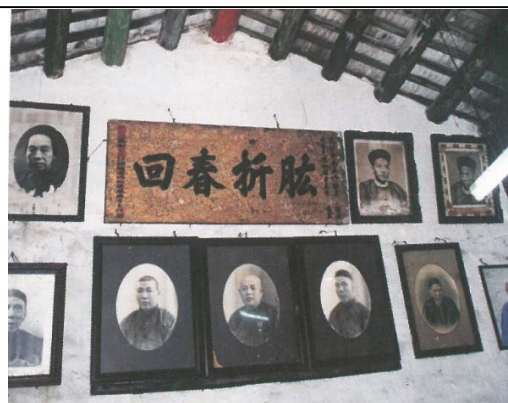
圖 1.5.6：趙家大屋屋內掛照