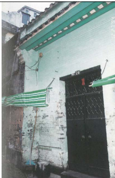
圖 1.5.3：1994 年趙家大屋正門