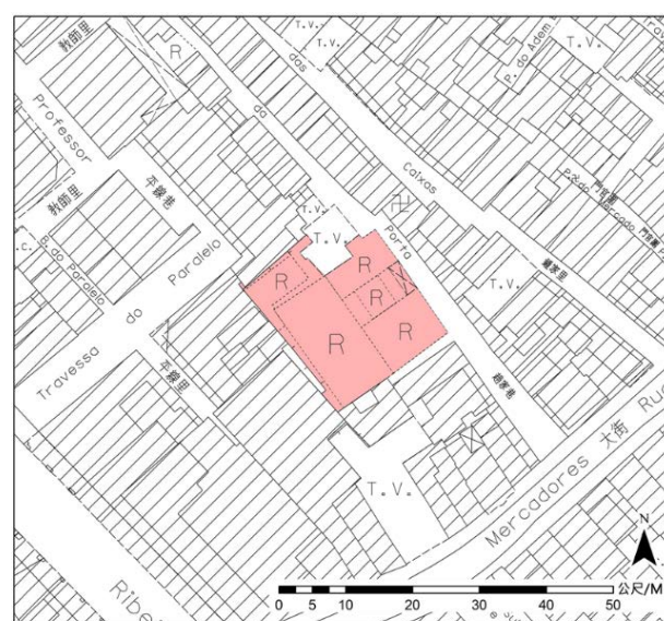
圖例 LEGENDA 待評定的不動產 - 紀念物 Bem Imóvel em Vias de Classificação - Monumento