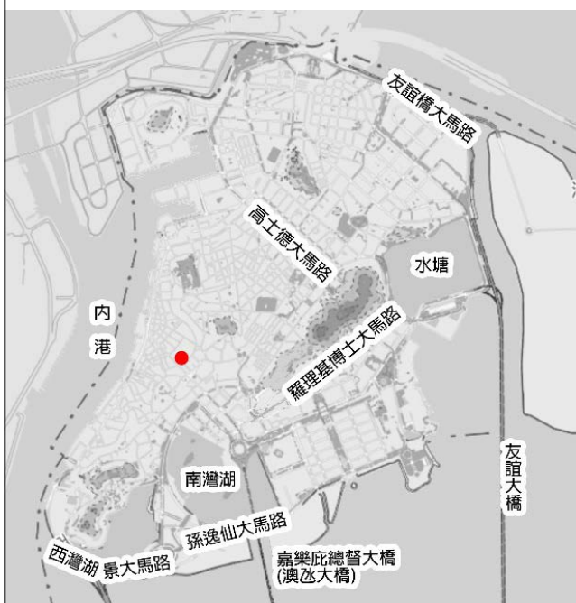
圖 1.1.1：待評定的不動產之位置