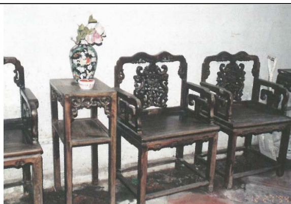
圖 1.5.5：二進大廳中的客座