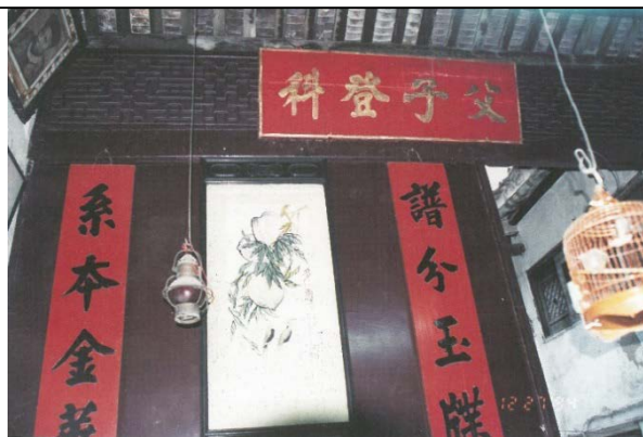
圖 1.5.7：趙家大屋內“父子登科”牌匾