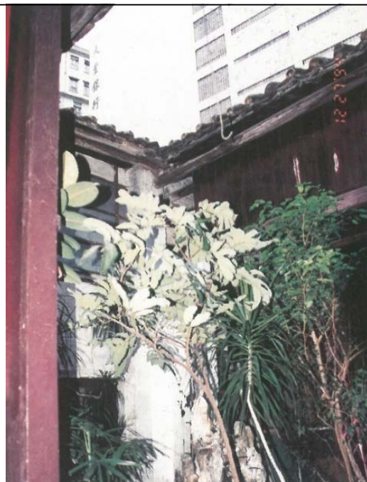
圖 1.5.4：二進天井假石山景池（1994 年）