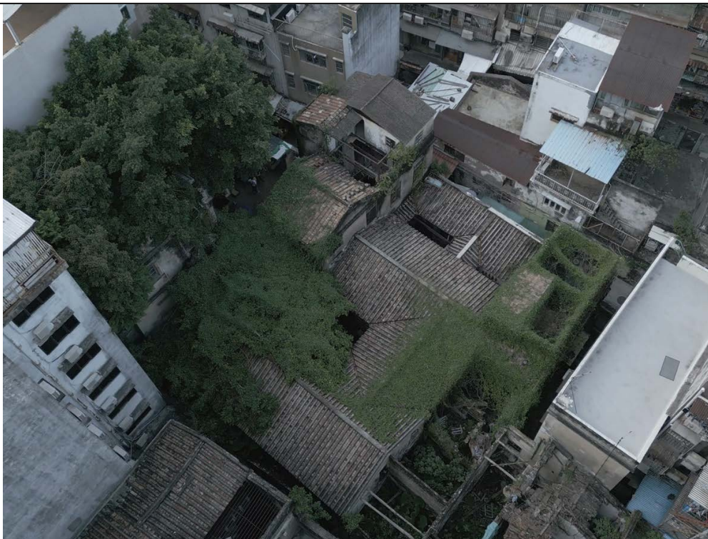
圖 1.5.2：趙家大屋航拍圖