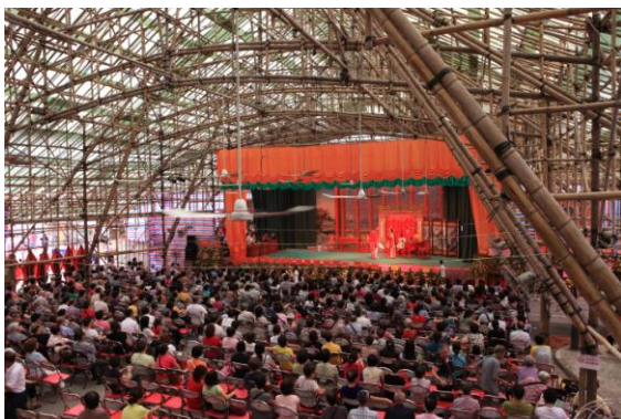
圖 7 戲棚內上演神功戲。