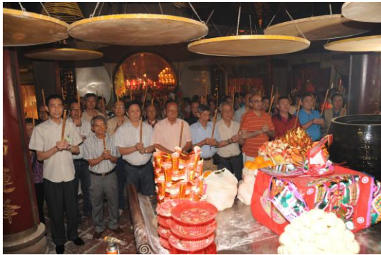
圖 5 天后誕期間進香祭拜媽祖，敬獻貢品。