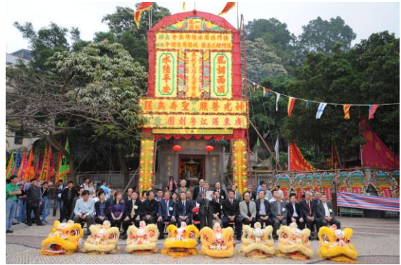
圖 4 於媽閣廟前地舉辦的天后誕慶祝活動。