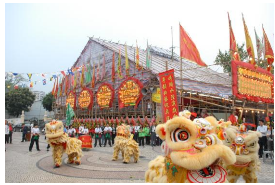
圖 6 天后誕期間於媽閣廟前搭建的神功戲棚。