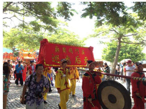
圖 8 農曆九月九日舉行的天后元君重陽昇天慶典出巡活動。