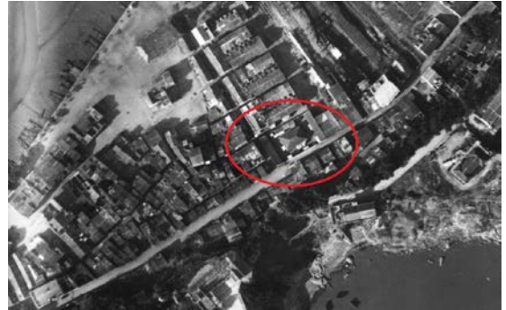
圖 9.5.2：1941 年航拍照。