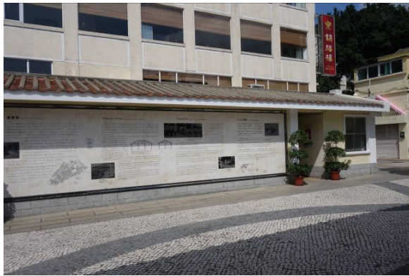
圖 9.5.3：門樓的線性形制及三角弧形山花。