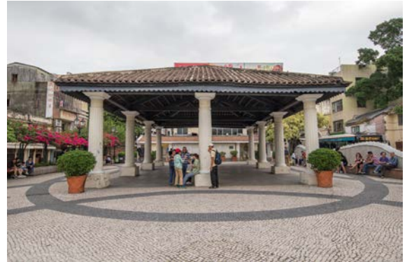
圖 9.5.6：嘉模墟石柱及屋頂。