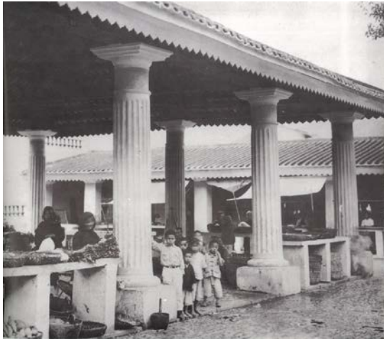
圖 9.5.1：氹仔市政街市 (約 1940 年)。