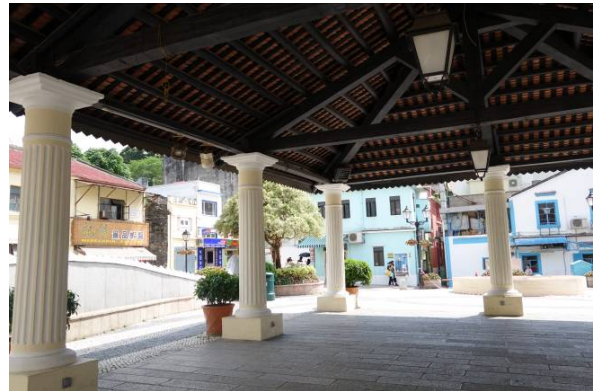
圖 9.5.4：今天的嘉模墟是開放式的廣場。