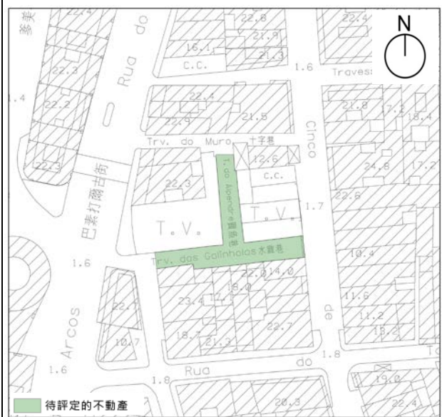
圖 8.1.2：待評定的不動產之範圍