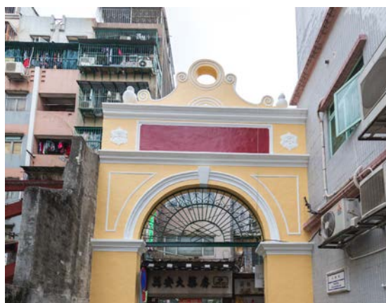
圖 8.5.6：門樓的線性形制及三角弧形山花。