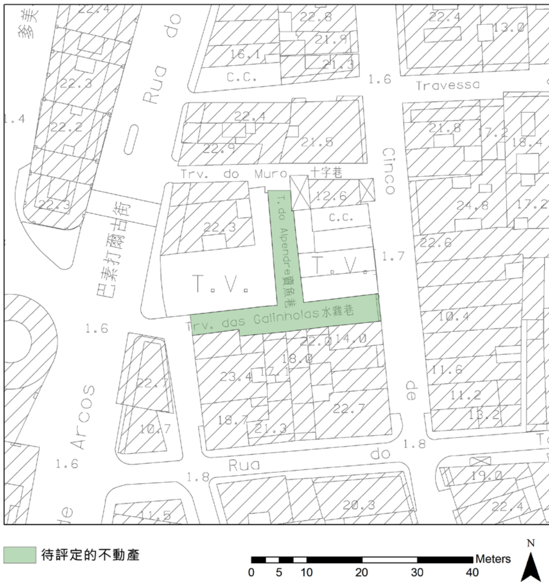
圖 8.4.1：原沙欄仔街市舊址（原泗孟街市舊址）之範圍