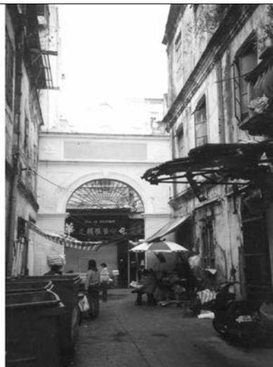
圖 8.5.3：門樓橫跨在水雞巷之上。