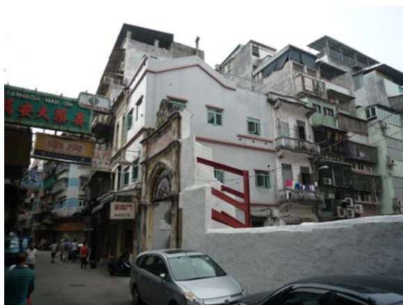
圖 8.5.5：位於十月初五日街與水雞巷交界的門樓。