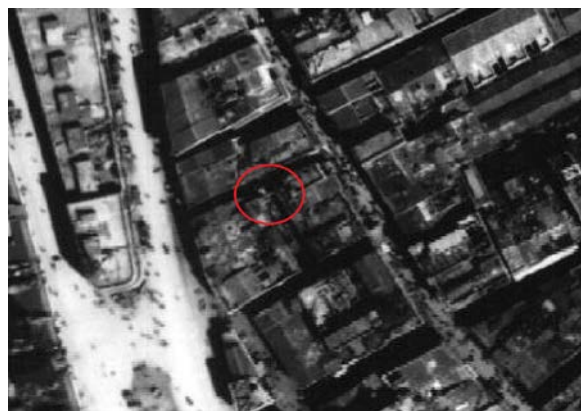
圖 8.5.2：1941 年航拍照，紅圈位置可看出當時賣魚巷亦有另一座門樓。