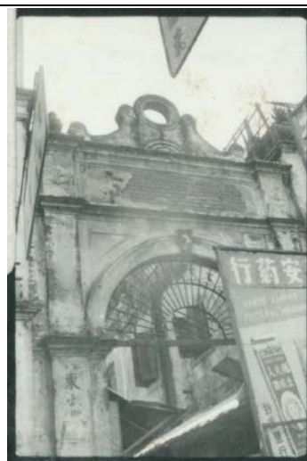
圖 8.5.4：門樓的歷史照片（約二十世紀中期）。